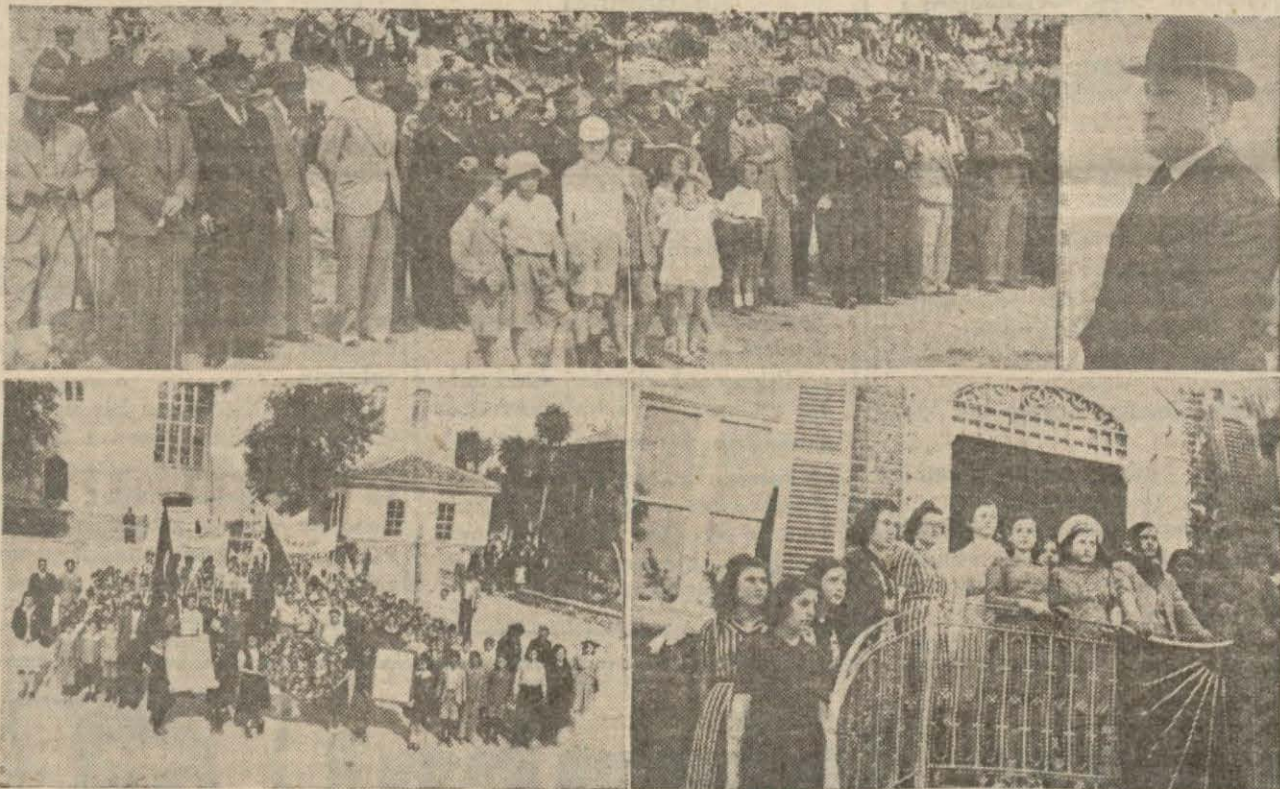
19 Mayıs gençlik bayramı bütün yurttaki gibi Konya, Muradlı, Bilecik ve Somada da coşkun bir şekilde kutlanmıştır. Resimler Soma ve Bilecikteki bayramdan intibalarla Bilecik Valisini söz söyleyenler göstermektedir.