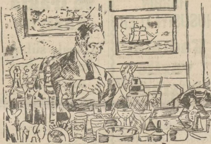
Bay Ruzvelt dostlarına ikram ettiği kokteylleri bazan bizzat hazırlar

Bir gün kitabın tabii: — Bay reis, neden bu kadar zahmete girişiyorsunuz? Halk nankör bir okuyucudur. Misa! ola- rak size reis Hooverin sizinkine benzer bir eserden ancak 1500 nüshasının satıldığını söyleyebil- rim, der. Roosevelt cevap verir: — Hoover 1500 nüsha mı sattı? Ben bir milyon satacağım.